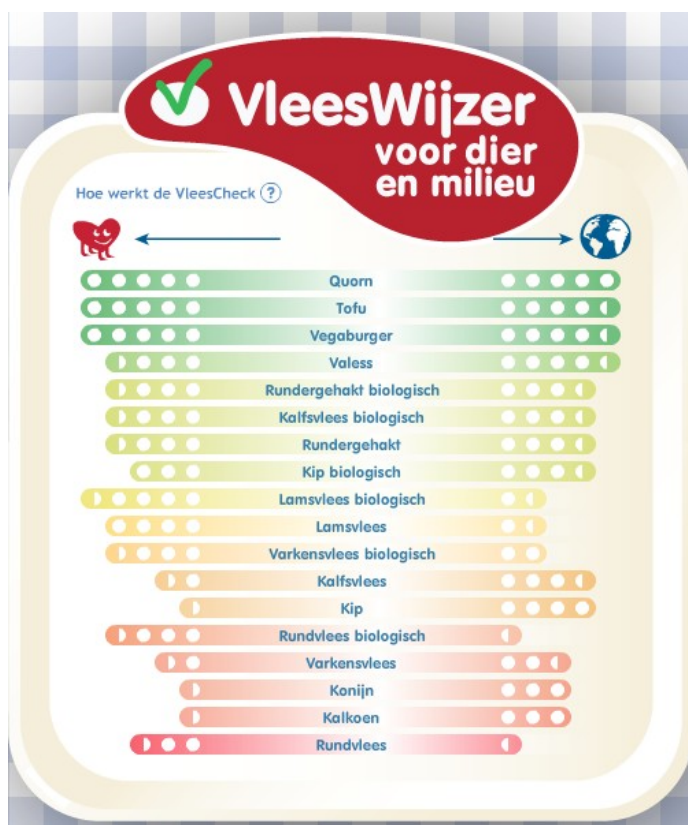
Figuur 5: De vleeswijzer geeft een indicatie van de milieupact per vleessoort of vleesvervanger. ( http://www.vleeswijzer.nl/ )