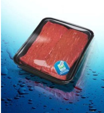
Figuur 1: CRYOVAC MIRABELLA® verpakkingssysteem voor vers vlees van Sealed Air Cryovac

Intelligente verpakkingen informeren de consument en geven bijvoorbeeld een indicatie van de reële versheid van de voedingswaren. Dit kan anders zijn dan op het etiket aangegeven, doordat de verpakking beschadigd raakte of doordat de koudeketen onderbroken is geweest. De houdbaarheidsdatum is dus actueel en het stimuleert de consument om het voedsel steeds koud te bewaren en tijdig op te eten. TTI's (time-temperature indicators) zoals het OnVu-label, focussen op temperatuurschommelingen en verkleuren in functie van geaccumuleerde blootstellingen aan hogere temperaturen.