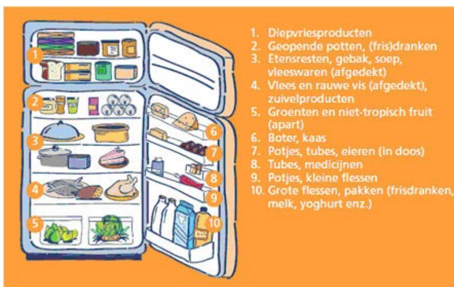
Figuur 4: De ideale indeling van de koelkast. www.voedingscentrum.nl

Een boodschappenlijstje kan helpen impulsieve aankopen, die tot 70% van de boodschappen kunnen uitmaken, tegen te gaan. Ook het nagaan van de aanwezige voorraden in de kasten en frigo voorkomt overbodige aankopen. Als men de aangepaste portiegrootte voor de maaltijden van de gezinsleden kent, voorkomt men dat er restjes overblijven op de borden. De houdbaarheidsdatum wordt best gecheckt in de winkel omdat het soms voorkomt dat er vervallen producten op de rekken blijven liggen. Hoe beter de koudeketen wordt gerespecteerd, hoe langer de gekoelde en diepgevroren producten goed blijven. Hierbij worden deze producten best het laatst gekocht en bewaard in een geïsoleerde zak. Terug thuis worden deze best zo snel mogelijk in de frigo geplaatst in de aangepaste zone. Een frigo is namelijk niet overal even koud. De producten die eerst zijn aangekocht, zouden eerst opgebruikt moeten worden. Bereide voedingswaren moeten opgegeten, gekoeld of diepgevroren worden binnen twee uur (één uur bij warm weer). Hierna is de bacteriële groei te ver gevorderd om de maaltijd nog op te kunnen eten. Verdere typische hygiëne regels helpen natuurlijk ook om het bederven van voedsel tegen te gaan.