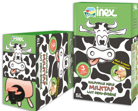
Figuur 2: De milktap, bron: nv Inex

Steeds meer verpakkingen kunnen na opening terug gesloten worden, zodat er een betere portionering is en het overblijvende voedsel beter beschermd blijft. Verder is er een trend in Europa om verpakkingen van verschillende volumes aan te bieden, zodat zowel grote als kleine gezinnen aan hun trekken komen. Een voorbeeld van zo een doseringsverpakking is de Bag-in-Box (BIB). Het product, bvb melk, wordt aseptisch in een plastic zak verpakt, afgesloten met een tapkraantje. Via dit kraantje kan geen lucht binnendringen, zodat de melk langer vers blijft, zelfs na opening.